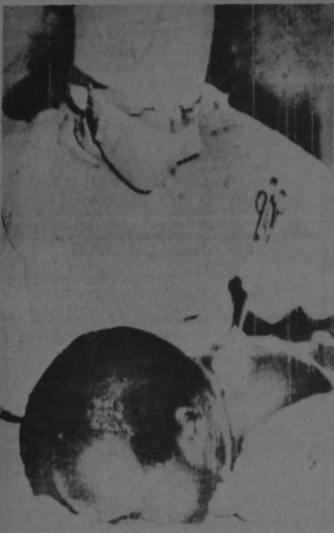
OPERAN A AMIN.- Un diario de Uganda publicó esta foto en la que decía que un cirujano soviético operaba al Presidente Idi Amin.

Se trata del representante Edward I. Koch, de 52 años, y del Secretario de Estado del estado de Nueva York, Mario Cuomo, de 45 años, que presentó su candidatura a instancia y con el respaldo del gobernador demócrata Hugh L. Carey.