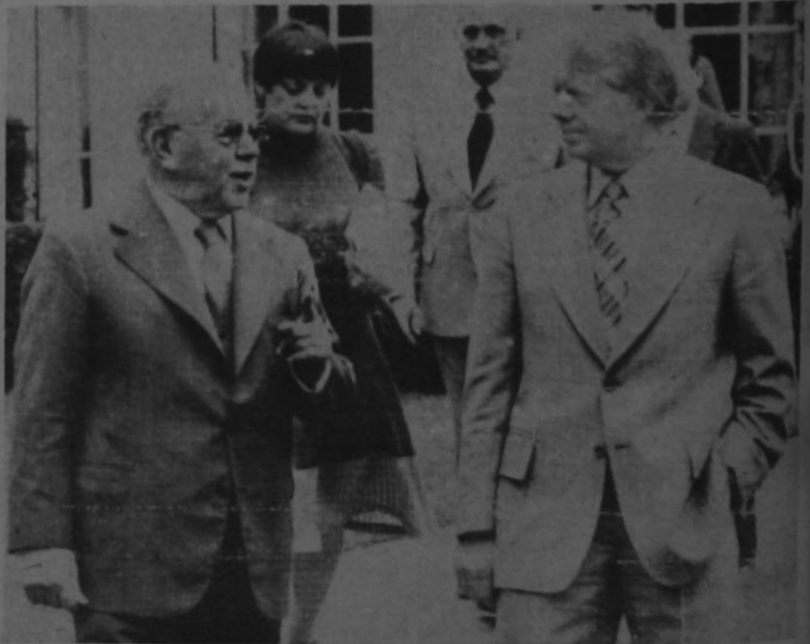
Méndez conversa con Carter

Carter dijo que se sentía muy esperanzado después de su conversación sobre la cuestión nuclear pues Videla le informó que la Argentina no tenía intención de entrar en la producción de armas nucleares.