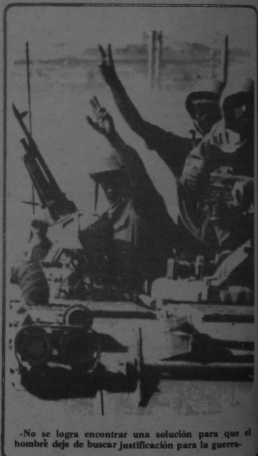
-No se logra encontrar una solución para que el hombre deje de buscar justificación para la guerra-

El SIPRI, una institución independiente financiada por el parlamento de Suecia y fundada en 1966 para celebrar los 150 años de la sistemática neutralidad de ese país escandinavo, aclara que sus estadísticas sobre el gasto militar en la Unión Soviética son tomadas del presupuesto nacional de ese país, convertido a dólares norteamericanos de acuerdo con estimaciones