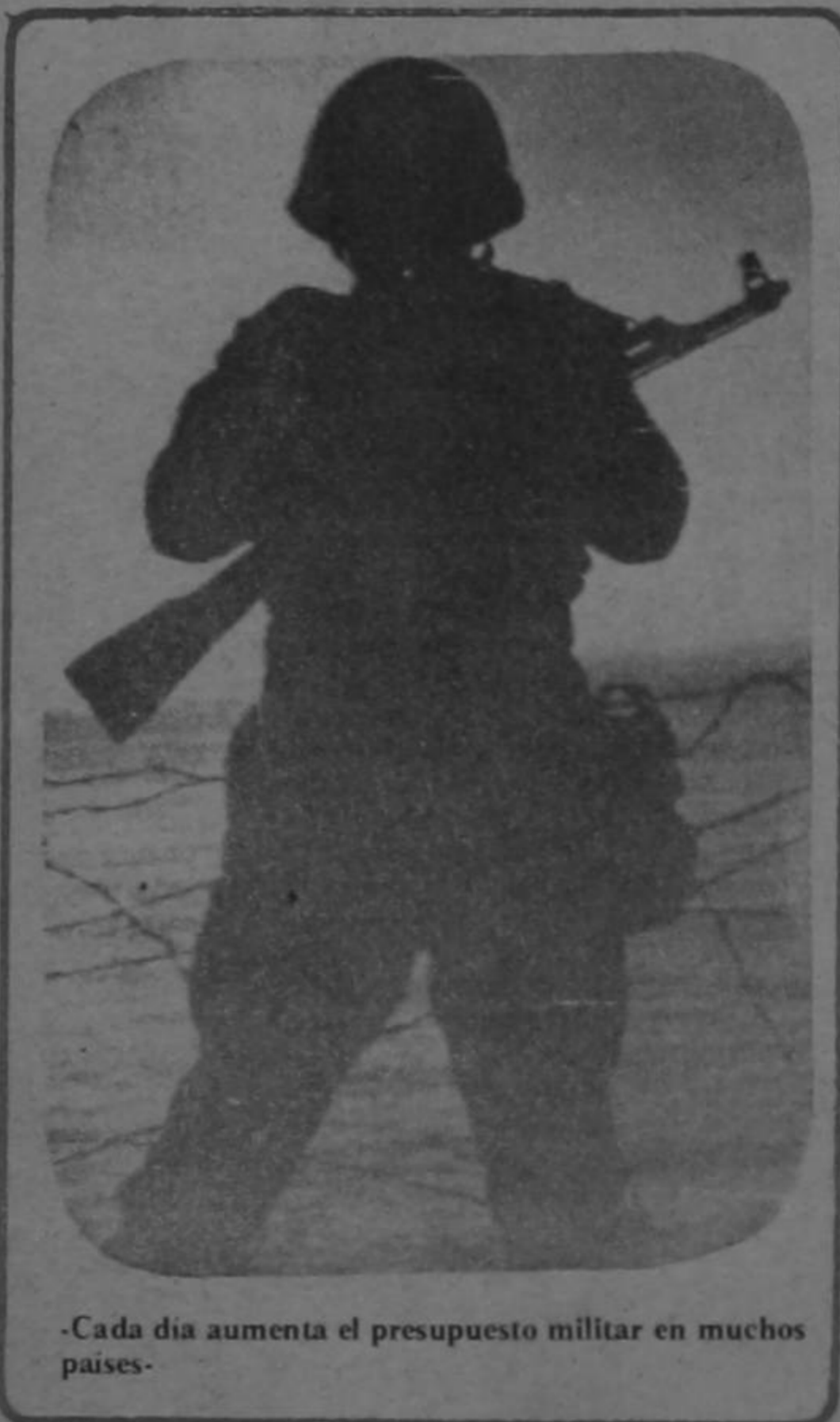
-Cada día aumenta el presupuesto militar en muchos países-

La conclusión del SIPRI ante estadísticas tan sombrías es pesimista, entre otras razones porque los expertos del instituto no logran ver cómo podrá detenerse la capacidad creativa que, en materia bélica, ha mostrado hasta ahora la humanidad, y sobre todo, los Estados Unidos y la Unión Soviética.