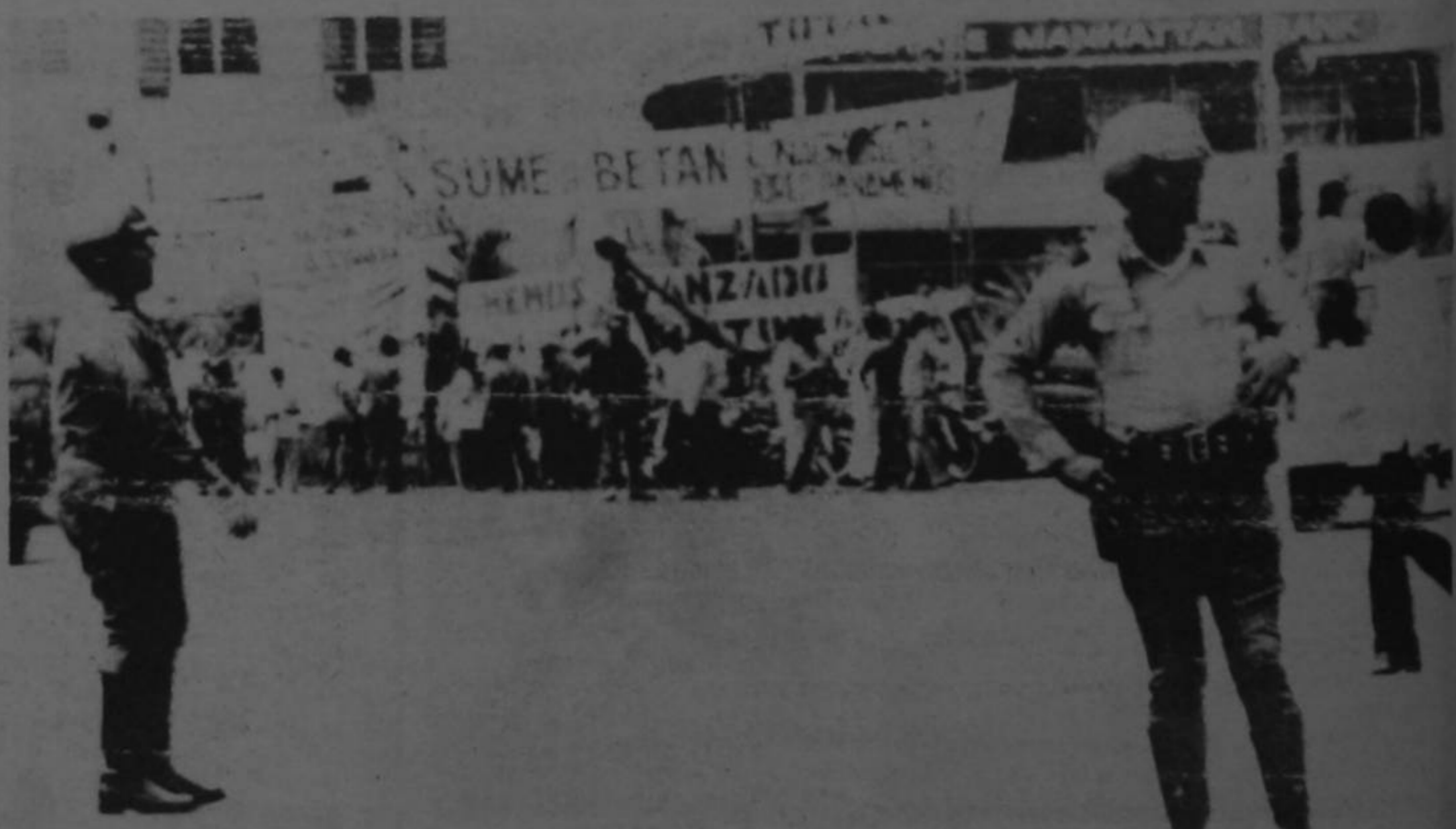
EN PANAMA.- Guardias panameños dirigen el tránsito en la Plaza 5 de Mayo, en la que el General Omar Torrijos, dirigió al pueblo a su regreso de Washington, donde firmó el tratado.

Un avión voló dejando caer volantes que decían: "El pueblo panameño debe mostrar al mundo que está unido... Torrijos sí Reagan no", refiriéndose al ex gobernador de California, que encabeza una campaña para que el Congreso de Estados Unidos no ratifique el tratado firmado en Washington por Torrijos y el Presidente Carter.