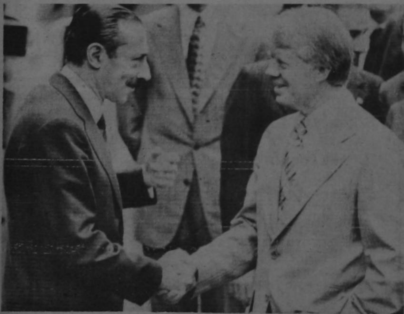
Carter despidió a Videla

El padre estaba en el trabajo cuando se produjo la tragedia.