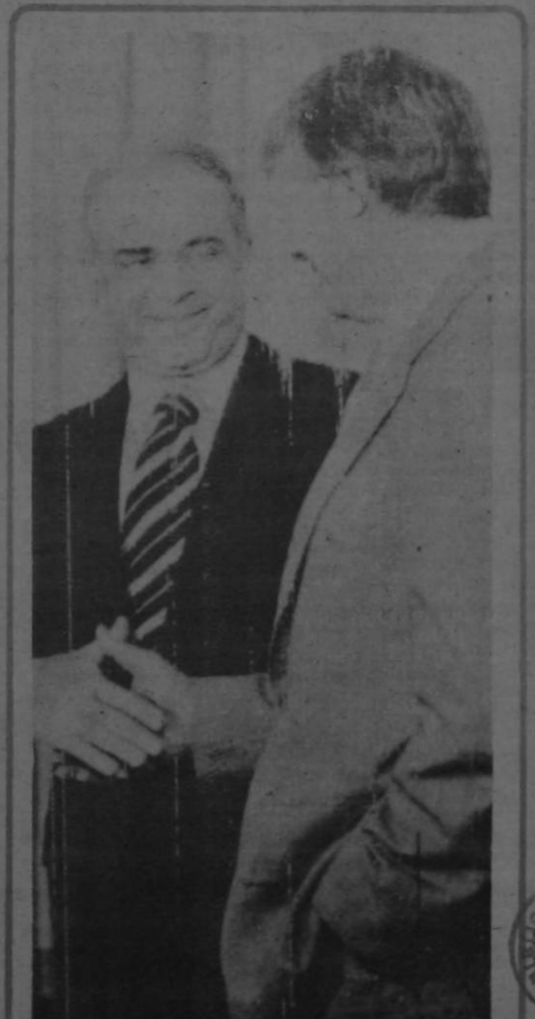
Jimmy Carter dijo al Presidente Oduber, de Costa Rica, que nuestro país es una "democracia pura".

El presidente de la Junta señaló este hecho al anunciar la total reorganización de esa entidad de protección social que a partir del mes pasado dejó la administración del primero y uno de los más grandes hospitales del país, el San Juan de Dios. (Pasa a la página 18)