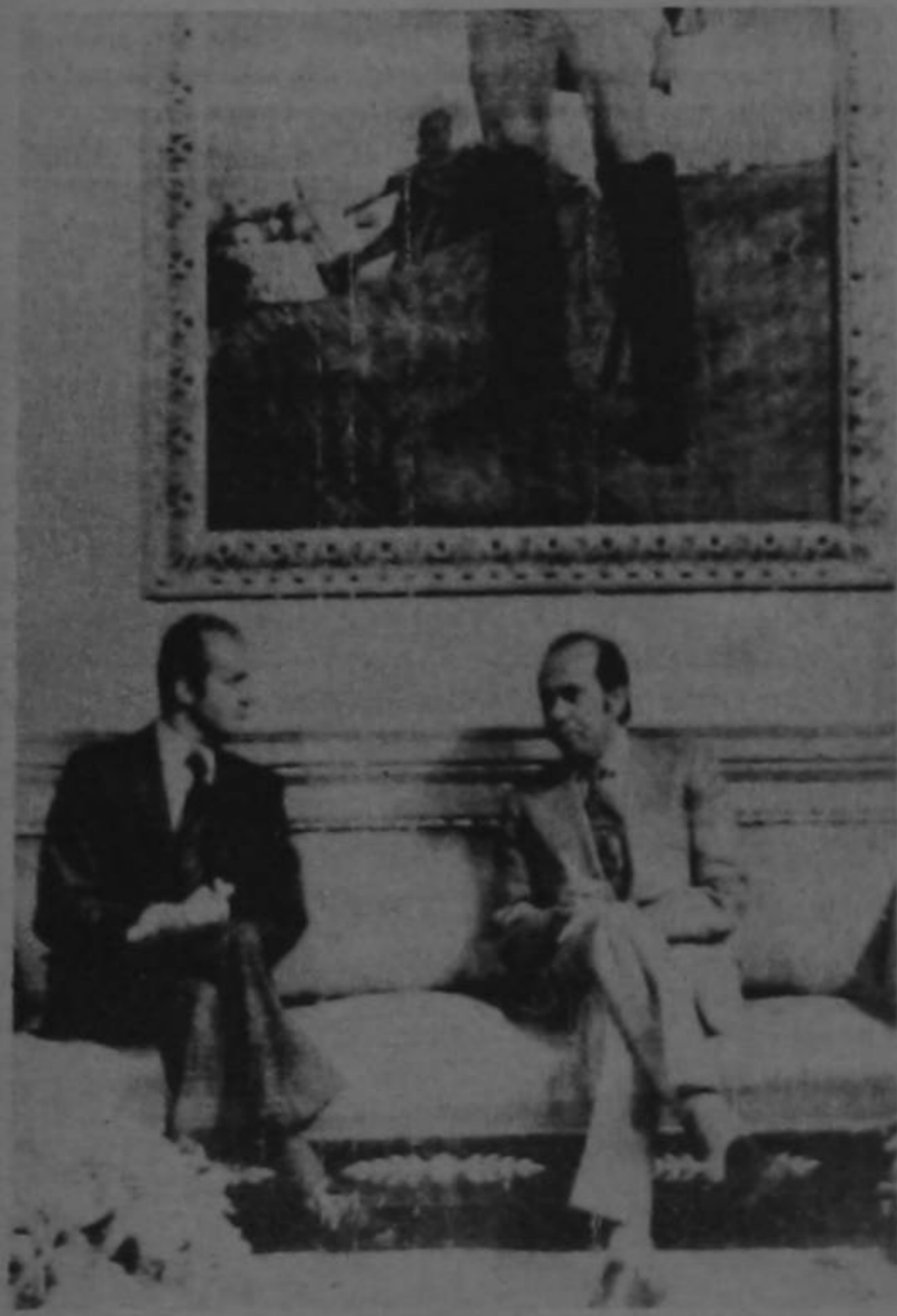
CONVERSACIONES.- Bajo un retrato de Simón Bolívar se reúnen el Rey Juan Carlos y el Presidente Carlos Andrés Pérez, en el Palacio de Miraflores en Caracas.

Caracas, (AP) — El Rey Juan Carlos de España recordó en una sesión conjunta del Congreso venezolano la herencia común de ambas naciones y prometió que la futura política exterior española se centrará en América Latina.